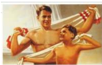
Если хочешь быть здоров-закаляйся!

Домашнее задание: нарисовать лимон и попросить родителей рассказать вам, что они еще знают о лимоне. А завтра вы нам всем расскажете новую информацию.